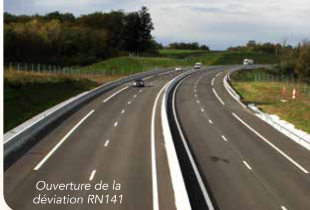
Ouverture de la déviation RN141